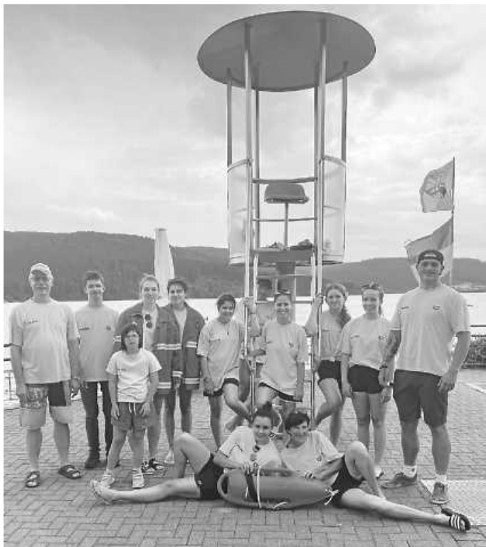
Das Aufsichtsteam des Schwimmvereins Nusplingen am Schluchsee Text und Foto Lara Veaser

Vorstandschafft Schwimmverein Nusplingen