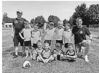
3. Bambini Spieltag

Am vergangenen Samstag konnten wir wieder mit 2 Mannschaften am 3. WFV Spieltag teilnehmen. Bei schwül-warmem Wetter absolvierten beide Mannschaften jeweils 5 Spiele. Die Spielzeit betrug 8 Minuten pro Spiel. Wie an den beiden anderen Spieltagen waren die Jungs sehr engagiert bei den Spielen und haben unsere Vereine wieder toll repräsentiert. Wir wollen den Kindern Fairness, Respekt, Teamfähigkeit und soziale Kompetenz vermitteln. Dies haben sie an diesem Spieltag gezeigt. Am Ende des Spieltages gab es für jeden Spieler die verdiente Medaille, die alle in der Folge stolz um den Hals trugen. Im Bambini Alter bis zu den C-Junioren dürfen natürlich auch interessierte Mädchen mitmachen. Also Mädels ran an den Ball meldet euch, wenn ihr am Fußball interessiert seid.